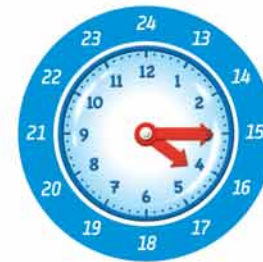
Die Analoguhr zeigt